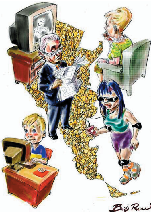
Ilustración: Bob Row

El capitalismo hace uso de varios instrumentos ideológicos para hacer creer a la sociedad que con trabajo y esfuerzo algún día llegaran a ser ricos, lo cual es una total mentira porque el salario solo alcanza para mantener tu estado de clase social, es decir, siendo siempre un trabajador ( proletario ) y nunca un burgués.